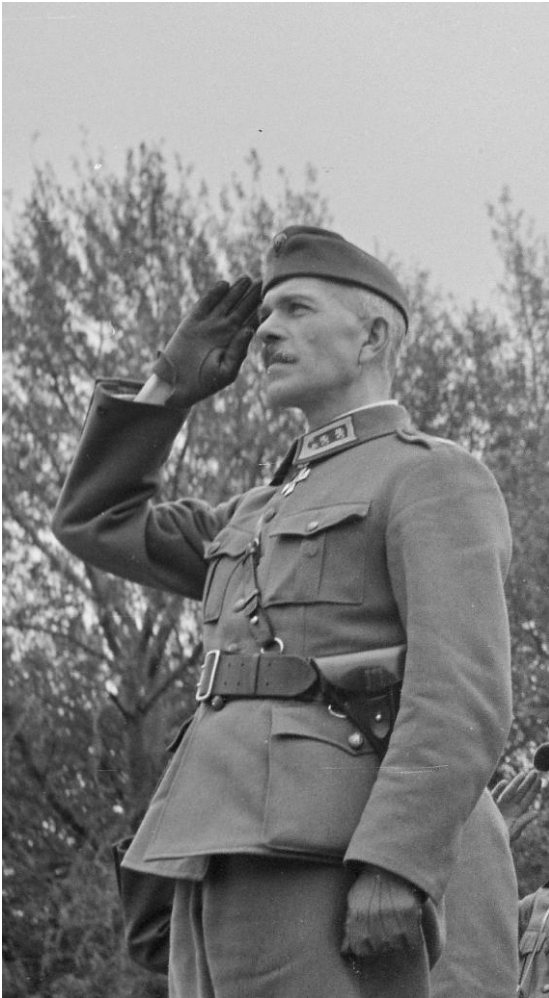
Kenraali K L Oesch Viipurissa 31.8.1941

Karl Lennart Oeschistä (1892–1978) ei alun perin pitänyt tulla sotilasta. Hän piti itseään pasifistina. Tämä unohtui, kun toiveet Suomen valtiollisesta vapaudesta konkretisoituivat vähitellen suoraksi toiminnaksi. Se myös vei hänet sotilasuralle. Se alkoi 1915 Saksassa. Hänet tunnetaan varsinkin kesän 1944 tapahtumien myötä. Tuolloin Suomeen kohdistui Neuvostoliiton suurhyökkäys ja jääkärikenraaliluutnantti Oesch johti Kanaksen joukot torjuntavoittoon.