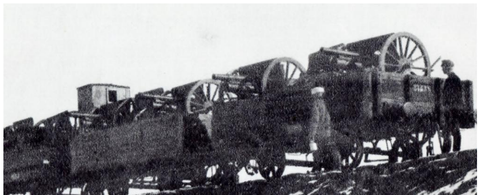
Osa runsaasta sotasaaliista

eli panssarijunan ja saivat runsaan sotasaaliin. Jääkärit olivat sitä lajittelemassa, kun yhtäkkiä hyökkäsi kolmisensataa punaista. He olivat venäläisiä tavoitteenaan vallata juna takaisin. Kiiwas taistelu pääsi