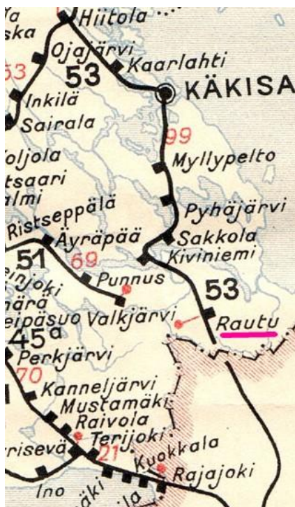
Raudun sijainti kartalla

Jääkäreiden pääjoukko palasi helmikuun lopulla 1918 Suomeen. Samoihin aikoihin lähinnä venäläisistä koottu punaisten osasto oli matkalla kohti Rautua. Osastossa oli tuhatkunta miestä. He olivat saapuneet Pietarista junakuljetuksella. Mukaan oli saatu useita tykkejä sekä konekiväärejä. Heidän hyökkäyksensä pakotti valkoiset vetäytymään. Valkoisia oli ollut alle sata. He jäivät puolustukseen Raudun kirkonkylään ja ratapihan lähistölle. Hyökkääjä asettui laajalle rautatieasema-alueelle ja ryhtyi valmistelemaan sitä puolustuskuntoon. Ilmeisesti heidän aikomuksenaan oli jäädä odottamaan apuvoimia. Vihollisen puolustustyöhön käyttämä aika mahdollisti sen, että myös valkoiset kykenivät lisävoimien avulla vahvistamaan omaa puolustustaan. Vähitellen rautatieaseman ympärille muodostui hevosenkengän muotoinen saartorengas.