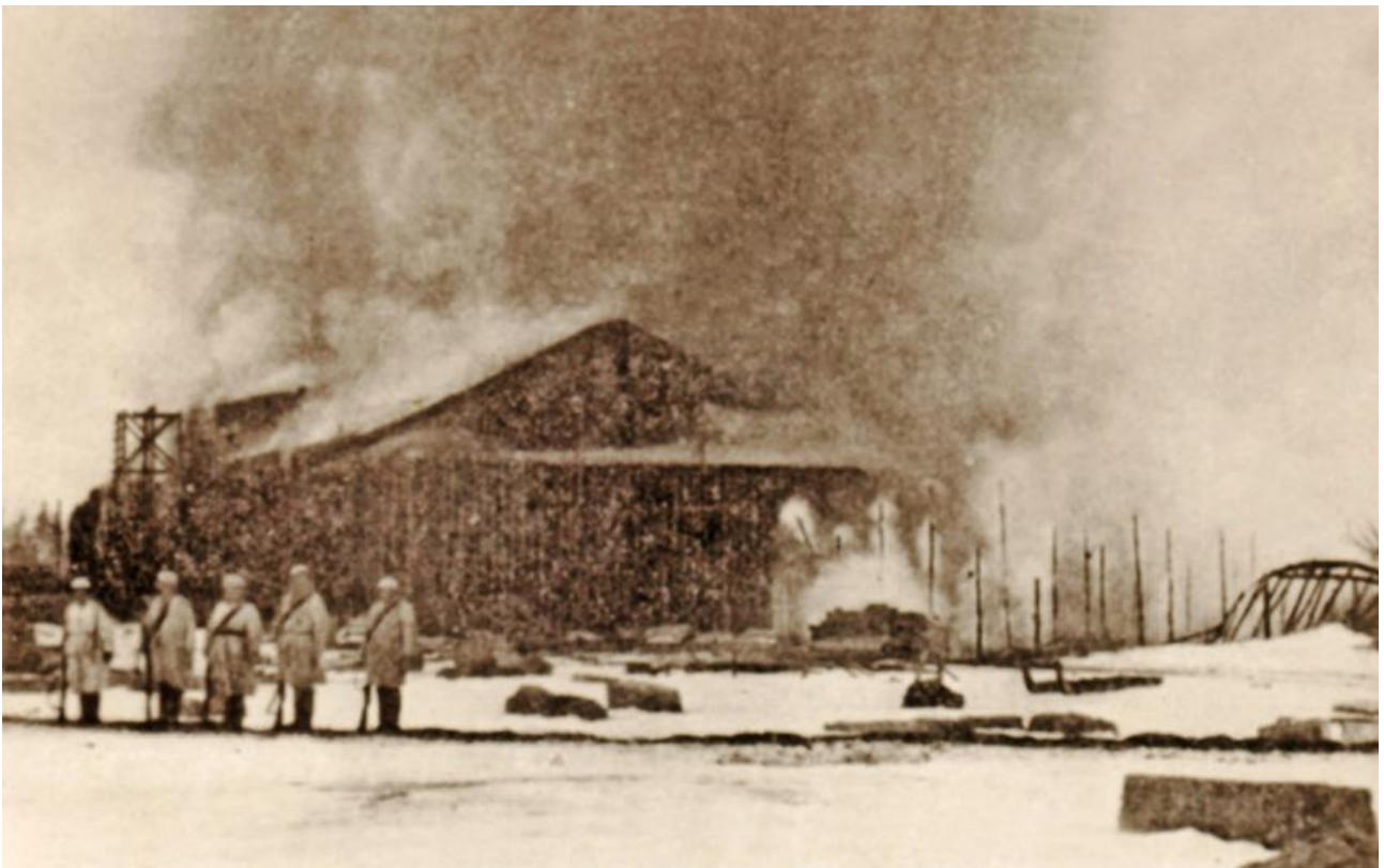
Raudun asema vuonna 1918

Huhtikuun alkupäivinä Sihvolla oli Raudussa käytössään noin 1 200 miestä sekä muutamia tykkejä. Valkoisten lukumäärä lienee ollut enimmillään noin 1 400 miestä. Punaisten puolella taisteli pitkälle toistatuhatta venäläistä ja tuhatkunta suomalaista. Asekuljetukset Pietarista olivat edesauttaneet sitä, että punaiset olivat saaneet käyttöönsä muun muassa kymmeniä konekiväärejä, viitisentoista tykkiä sekä lähes rajattomasti ampumatarvikkeita.